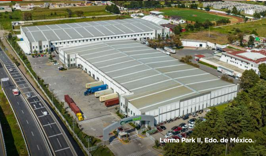
Lerma Park II, Edo. de México.