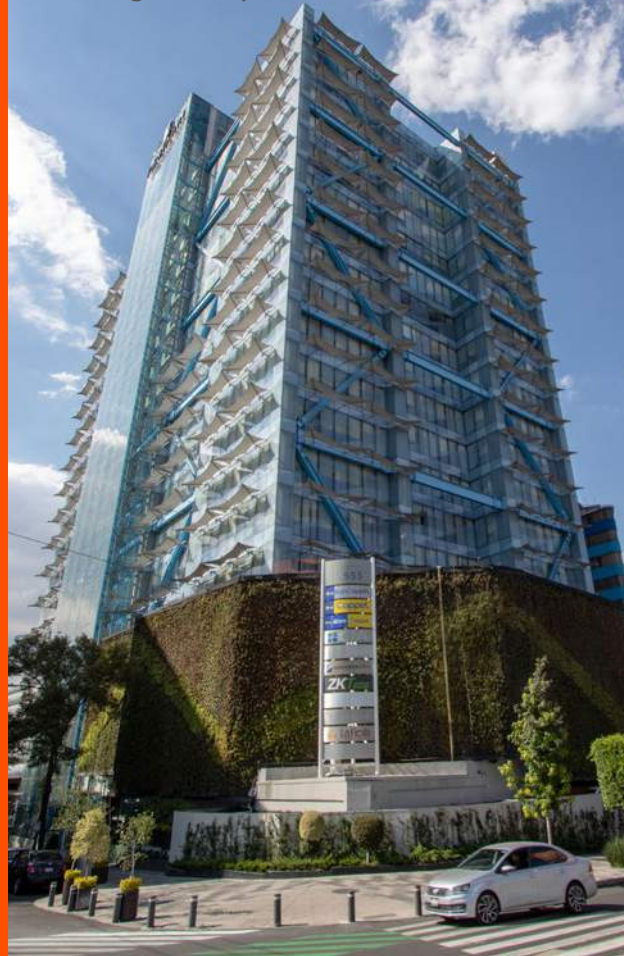
Torre Insurgentes 553, CDMX.

Consiste en ser la primera opción para satisfacer las necesidades inmobiliarias de nuestros arrendatarios, a través de una diversificación geográfica y por segmento de negocio, que ofrezcan alto potencial de crecimiento, ampliando nuestro portafolio mediante adquisiciones y desarrollos rentables en condiciones favorables de financiamiento y orientadas a generar valor sostenible a nuestros tenedores de CBFÍ's.