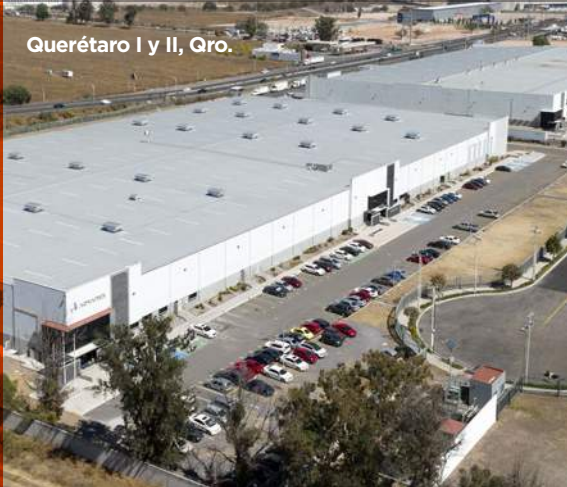
Querétaro I y II, Gro.