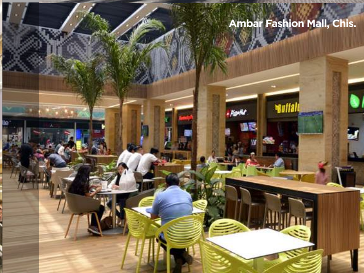
Ambar Fashion Mall, Chis.