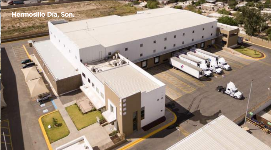
Hermosillo Día, Son.