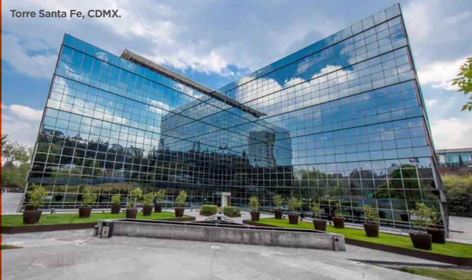
Torre Santa Fe, CDMX.