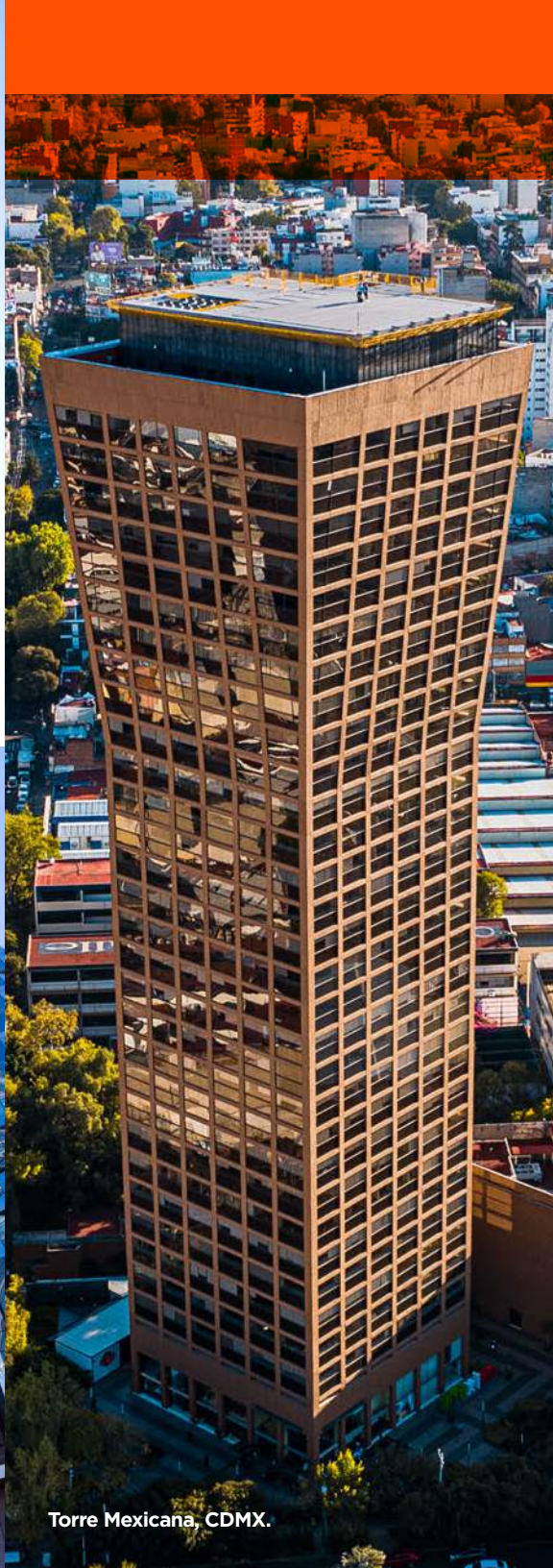
Torre Mexicana, CDMX.