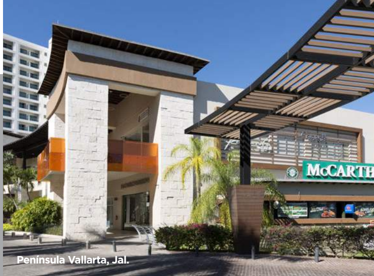
Península Vallarta, Jal.