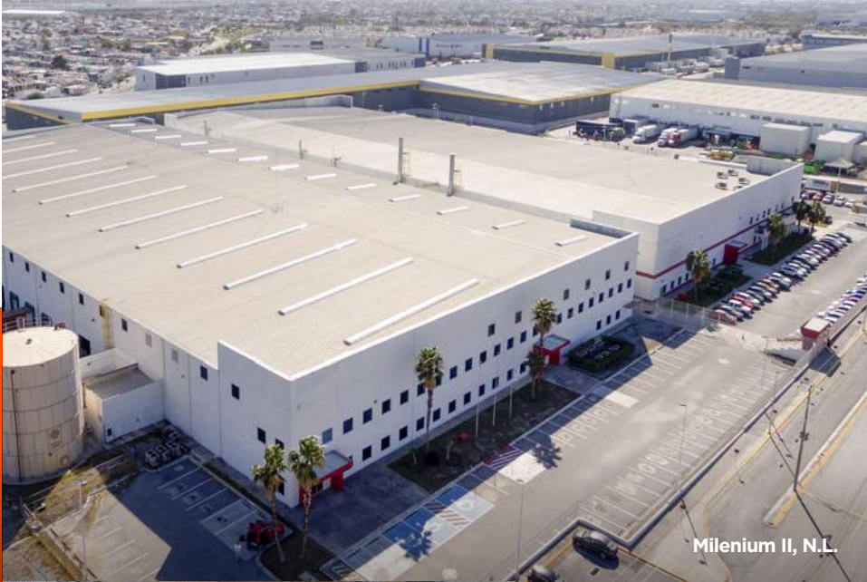
Milenium II, N.L.