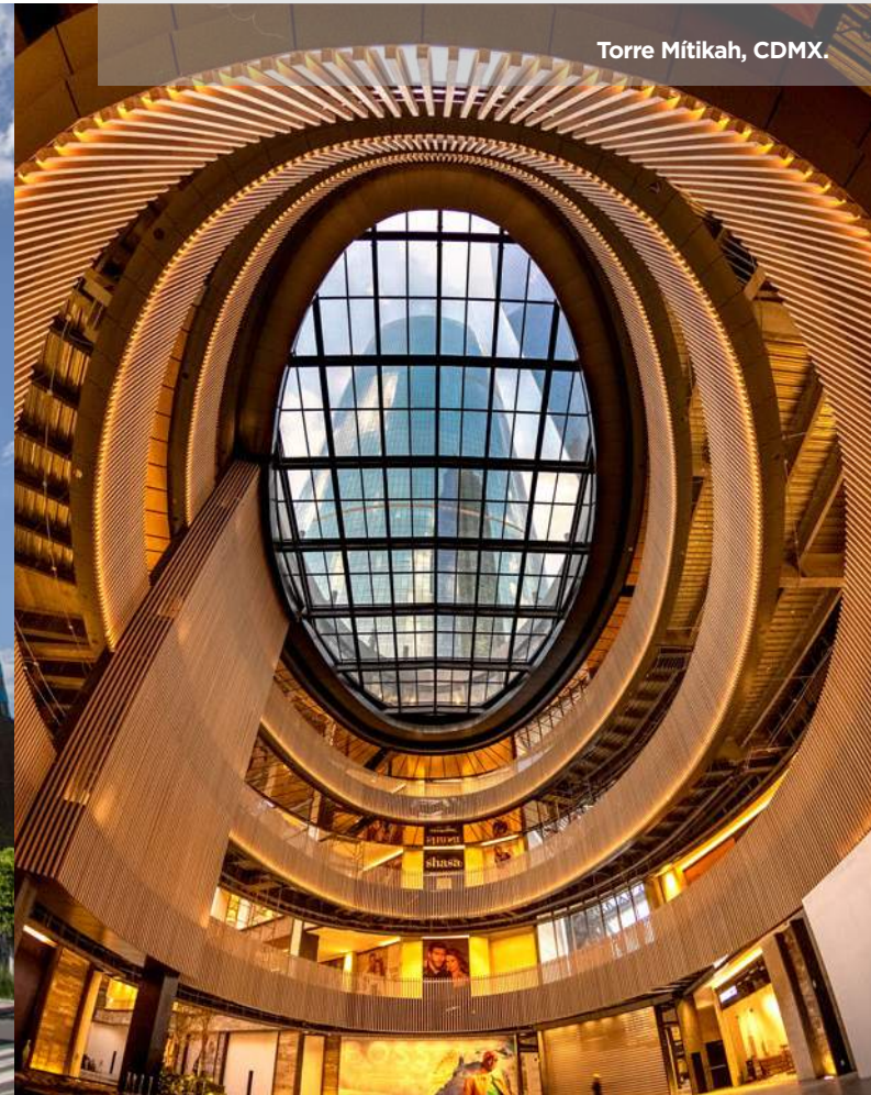
Torre Mítikah, CDMX.

Se ha caracterizado por una búsqueda activa de oportunidades, ya sea a través de adquisiciones estratégicas o el desarrollo de proyectos inmobiliarios. Su presencia se ha expandido en mercados clave de México, contribuyendo al dinamismo y desarrollo económico en esas regiones.