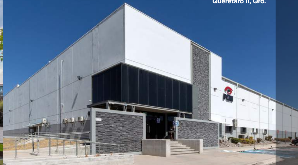
Querétaro II, Qro.