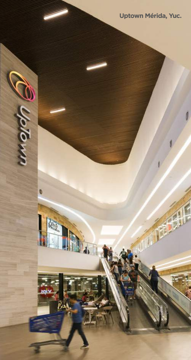
Uptown Mérida, Yuc.