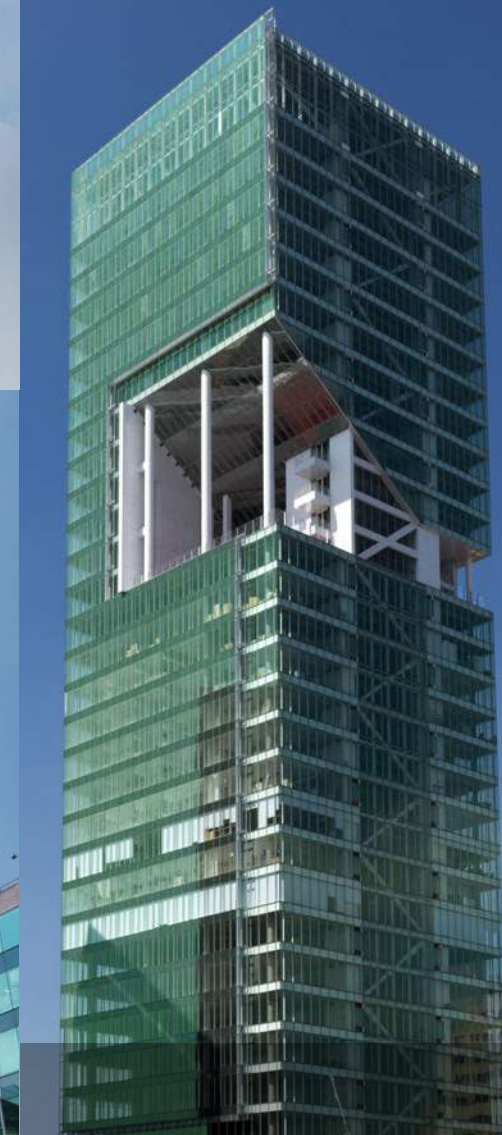
Torre Cuarzo, CDMX.