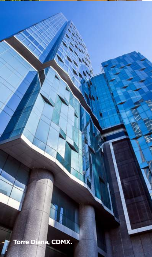
Torre Diana, CDMX.