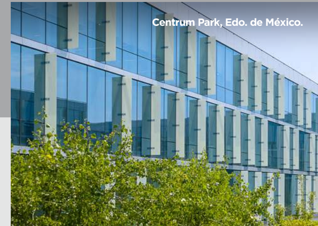
Centrum Park, Edo. de México.

En resumen, FIBRA UNO (FUNO) no solo es un líder en el mercado inmobiliario mexicano, sino también un actor clave en el desarrollo económico y la sostenibilidad. Su historia, estrategia de crecimiento y compromiso con la excelencia financiera y social lo convierten en un protagonista destacado en el panorama empresarial de México.