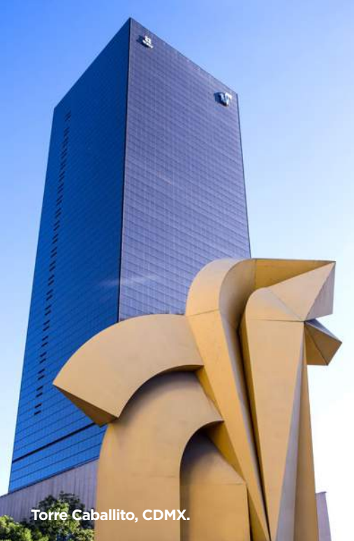
Torre Caballito, CDMX.