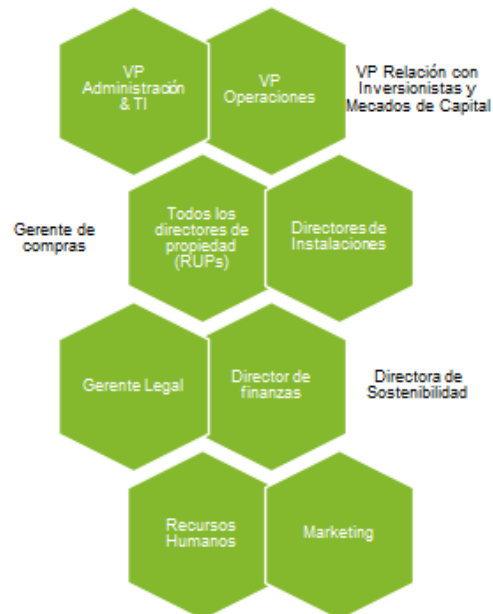
Figura 9. Comité de Sostenibilidad