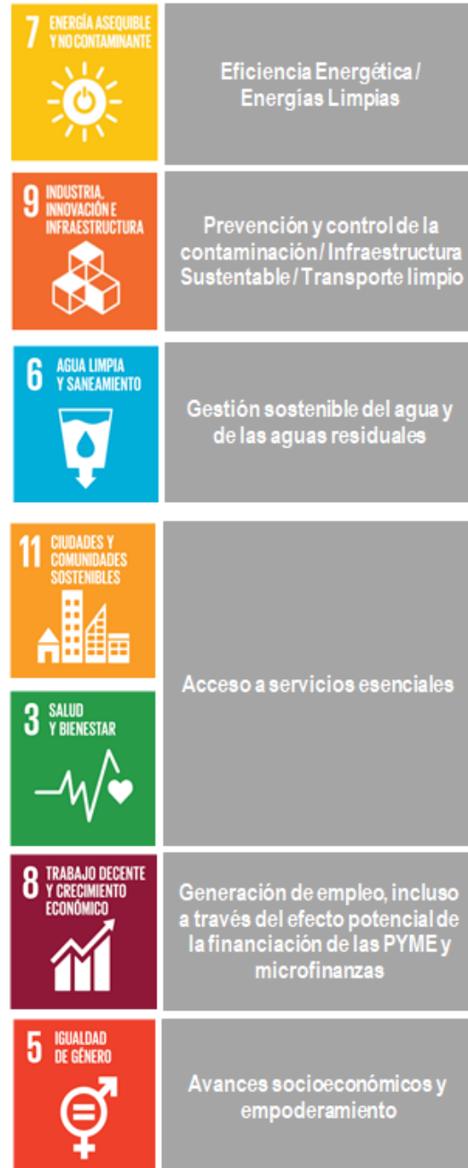
Figura 1. Categorías Elegibles del Marco de Referencia