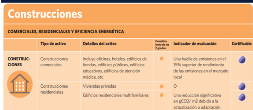
Figura 3. Criterio de Construcciones del CBI