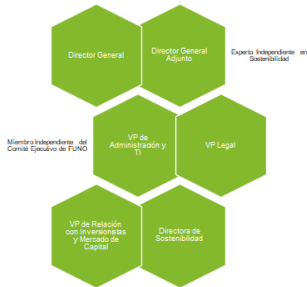
Figura 10. Consejo de Bonos Sustentables